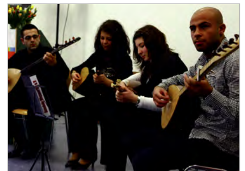
Musikeinlage Baglama Quartett des Anadolu Wuppertal e. V.