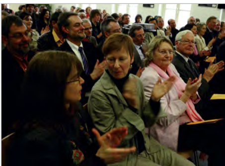
Gute Stimmung beim 25. Jubiläum des PJW

Für Jugendminister Armin Laschet liegt der Erfolg des Jugendwerkes darin, dass es sich konsequent für die Interessen von Kindern und Jugendlichen einsetzt. „Sie geben dem Eigensinn der Initiativen das organisatorische Dach. Und Sie sind als solches für die Landesregierung ein ver-