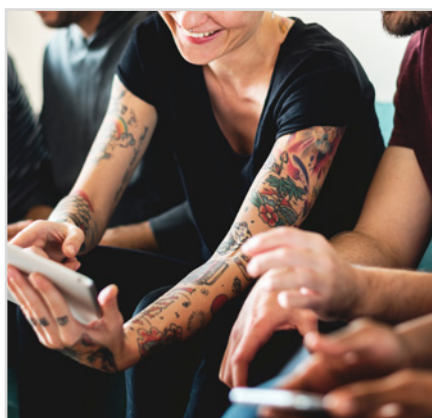
Die Fachtagung beleuchtet Chancen und Risiken von KI-Nutzung in Ambulanten HzE.

Künstliche Intelligenz verändert die Arbeitswelt – auch in den Ambulanten Hilfen zur Erziehung. Sie kann Mitarbeitende entlasten, die Qualität sozialer Angebote verbessern und neue Unterstützungsformen ermöglichen. Gleichzeitig entstehen wichtige