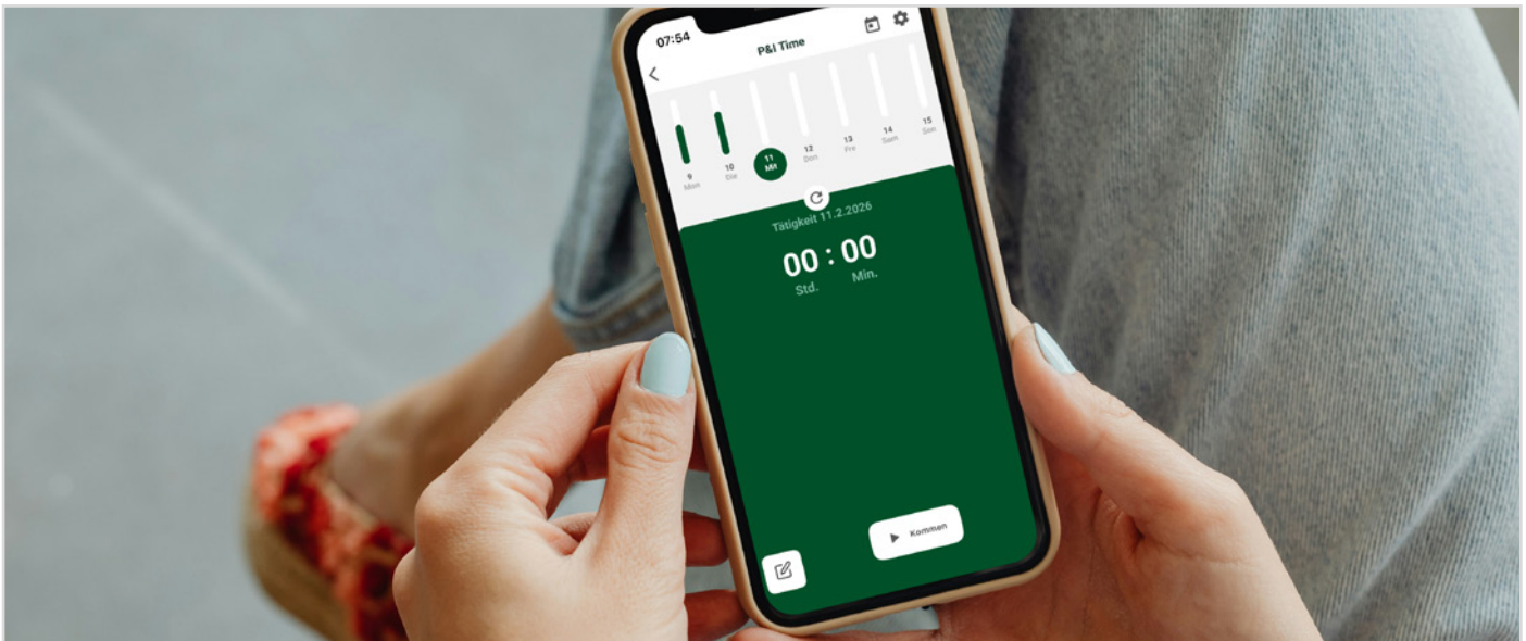
Praktisch für Arbeitgeber und Angestellte: Die neue digitale Zeiterfassung und Urlaubsverwaltung vom ParIDienst-Gehaltsservice.

oft auch die Zufriedenheit der Mitarbeitenden.