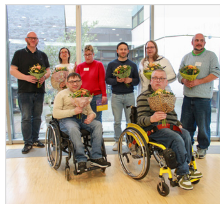
Die neuen Delegierten für die LAG der Werkstatträte NRW.

Ende 2025 wurden in den Werkstätten für Menschen mit Behinderungen in Nordrhein-Westfalen neue Werkstatträte und Frauenbeauftragte gewählt. Sie vertreten die Interessen der Beschäftigten und bringen ihre Anliegen über die jeweiligen Landesarbeitsgemeinschaften in die Landespolitik ein. Im Februar 2026 bestimmten die Mitgliedsorganisationen des Paritätischen NRW ihre Delegierten für die Landesarbeitsgemeinschaft (LAG) der Werkstatträte NRW und die LAG der Frauenbeauftragten in Werkstätten für Menschen mit Behinderung NRW.