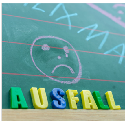
Alarmierende Zahlen: Jede dritte soziale Einrichtung fürchtet Angebotseinschränkungen.

Eine aktuelle Befragung der Bundesarbeitsgemeinschaft der Spitzenverbände der Freien Wohlfahrtspflege (BAGFW) macht deutlich: Viele soziale Einrichtungen stehen finanziell immer mehr unter Druck. Über 80 Prozent rechnen mit deutlichen Einschränkungen