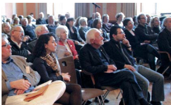
Rund 100 Teilnehmer/-innen folgten den lebhaften Diskussionen auf dem Podium – und diskutierten kräftig mit.