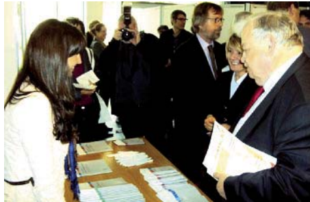
Integration: Freie Träger stärken

Für bessere Arbeitsbedingungen und mehr Geld im Pflegesystem hat Guntram Schneider, NRW-Minister für Arbeit, Integration und Soziales, vor rund 100 Teilnehmenden in Rheine argumentiert. Zu der öffentlichen Veranstaltung zur Zukunft der Pflege hatten der Paritätische im Kreis Steinfurt und das Fachseminar für Alten- und Familienpflege Rheine der Caritas eingeladen. | Foto: Minister Guntram Schneider (3. v. r.) mit Norbert Klapper (1. v. l.) und Hans-Peter Metje (2. v. r.), Paritätische Kreis Steinfurt, Petra Berger (3. v. l.) und Bernhard Herdering (2. v. l.), Caritas