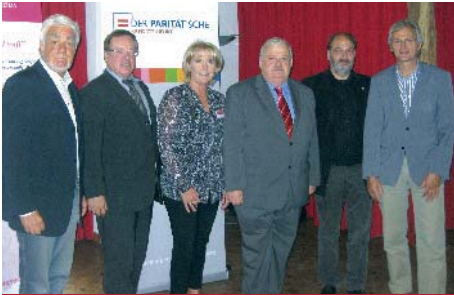
Arbeit in der Pflege höher bewerten