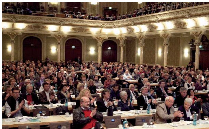
Rund 500 Gäste füllten die Wuppertaler Stadthalle