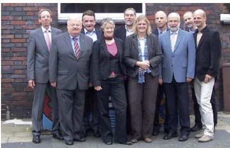
Perspektiven für Langzeitarbeitslose sichern