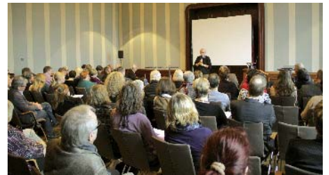
100 Gäste verfolgten die Diskussion zum Bundeskinderschutzgesetz

Landesebene getroffen werden.“ Im Wesentlichen um diese Punkte kreiste die anhaltende Kritik der Fachleute, die nun auch die Anrufung des Vermittlungsausschusses notwendig macht.