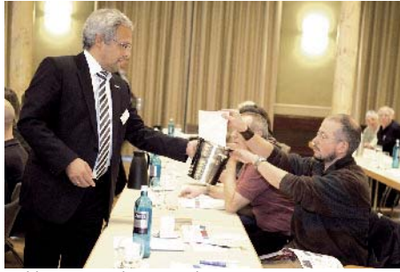
Wahlen zum Landesvorstand