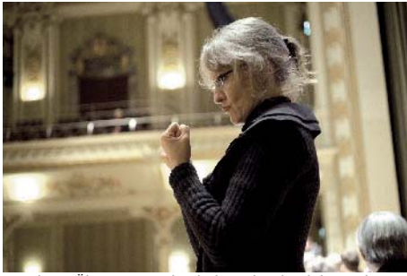
Simultane Übersetzung durch die Gebärdendolmetscherin