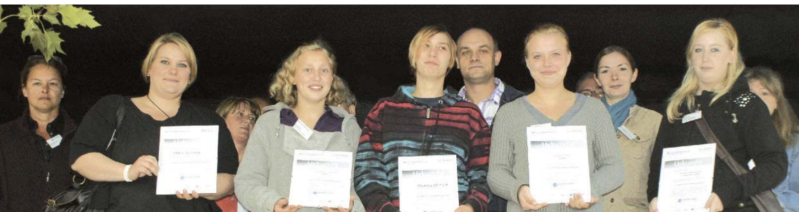
Beim Abschlussfest: Jugendliche und Arbeitgeber/-innen, die über das Projekt „Ausbilden ist Zukunft“ zusammengefunden haben.