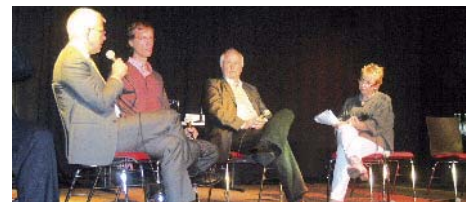
StippVisite: Inklusion ganz konkret