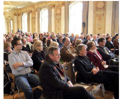
150 Gäste besuchten das Fachforum