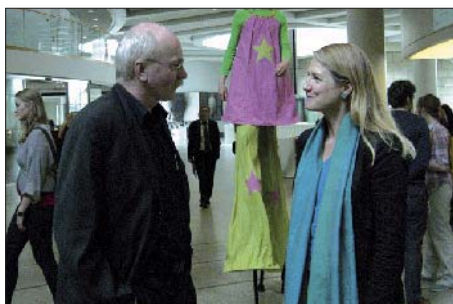
Jugendliche tragen ihre Wünsche in den Landtag